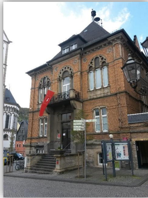
Tourist Information Boppard