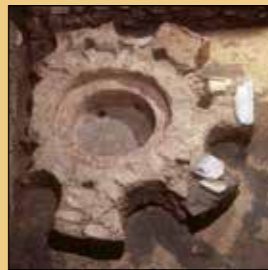
Frühchristliches Taufbecken, St. Severus-Kirche

Die Wandmalereien im Mittelschiff erzählen die Geschichte des hl. Severus, des Namenspatrons der Kirche, wie er als armer Wollweber zum Bischof von Ravenna auserwählt wird. Im rechten Seitenschiff finden sich Deckengemälde von Christus und Heiligen. Die Kirchenfenster stammen aus der 2. Hälfte des 19. Jhs. mit Ausnahme derjenigen im rechten Seitenschiff, die von einer zeitgenössischen Künstlerin aus Boppard geschaffen wurden. In die Kirchenrückwand sind mehrere frühchristliche Grabsteine eingelassen, von denen der Armentarius- und der Besontio-Stein die ältesten sind (5./6. Jahrhundert).