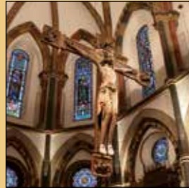
Triumphkreuz, St. Severus-Kirche

Zwei besonders qualitätsvolle Ausstattungstücke sind der Erbauungszeit der Kirche zuzuordnen: das über dem Hauptaltar hängende spätromanische Triumphkreuz mit dem gekrönten Christus als Sieger über den Tod, sowie die Skulptur der feinsinnig lächelnden, Liebreiz ausstrahlenden Madonna mit Kind und Lilienzepter.